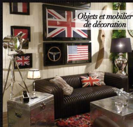
Objets et mobilier de décoration

Zoffany chez Sanderson , 19, rue du Mail, 75002 Paris, tél.: 01 40 41 17 76.