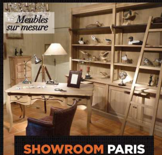
Meubles sur mesure

SHOWROOM PARIS 68 avenue Ledru Rollin 75012 PARIS